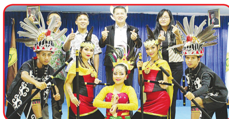
SENIMAN: Para seniman yang menampilkan atraksi tari berfoto bersama.

dha Nalanda adalah perguruan tinggi Buddha tertua di Indonesia. Dan telah terbukti menghasilkan lulusan berkualitas yang tak terhitung jumlahnya.