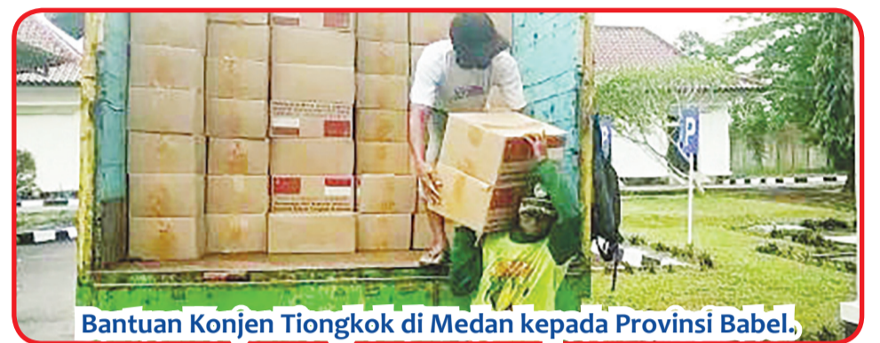
Bantuan Konjen Tiongkok di Medan kepada Provinsi Babel.