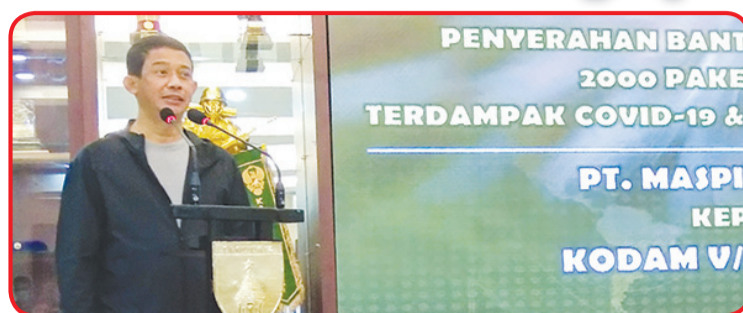
Pangdam V Brawijaya Mayjend TNI Suharyanto memberi pidato sambutan.

SURABAYA (IM) - Guna membantu meringankan beban masyarakat, baik yang terdampak Covid-19 maupun terdampak bencana Gunung Semeru, Maspion Group memberikan 2.000 paket sembako, yang disalurkan melalui Kodam V Brawijaya.