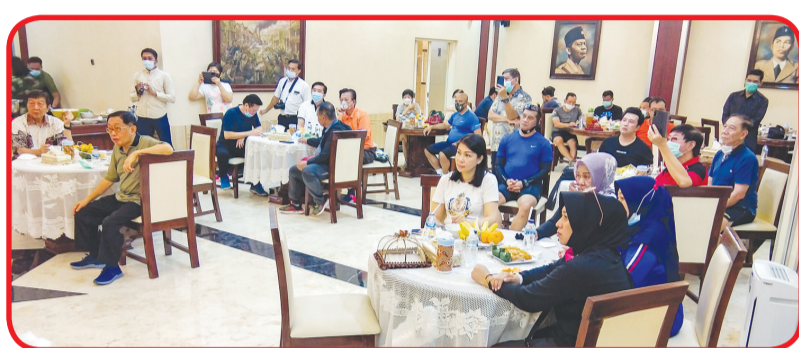
Kegiatan dihadiri pejabat utama Kodam V Brawijaya dan sejumlah pengusaha Jawa Timur yang tergabung dalam Dengkul Club.