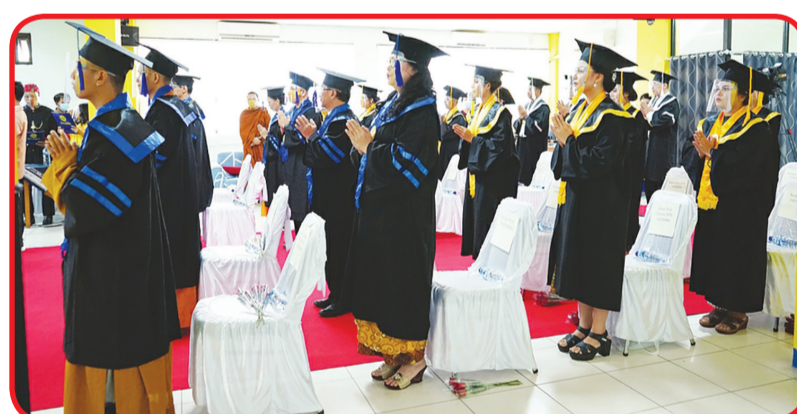
Para wisudawan di ruangan wisuda.

Upacara wisuda STAB Nalanda dipimpin Ketua STAB