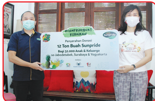
Penyerahan donasi buah ke Yayasan Waroeng Imaji.