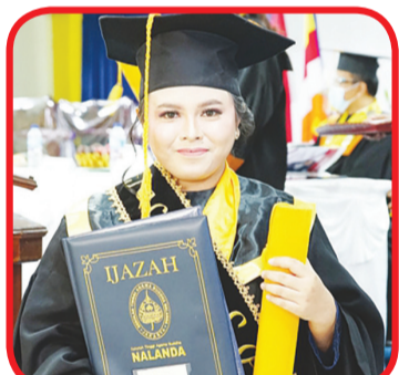
Wisudawan Sacitta menerima ijazah.