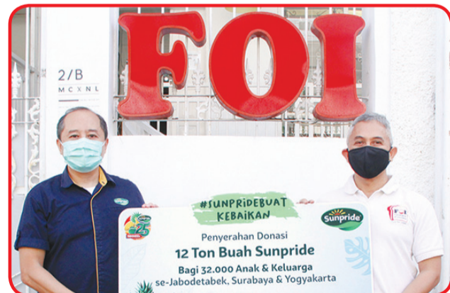
Penyerahan donasi buah ke Foodbank of Indonesia.