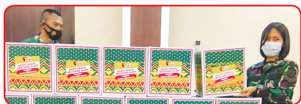
Paket sembako yang siap disalurkan ke masyarakat yang membutuhkan.

Lobi kantor Pangdam V Brawijaya, Surabaya, Jumat (11/12).