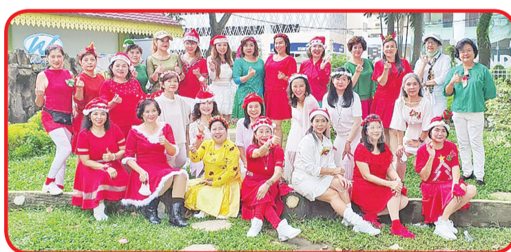
FOTO BERSAMA: Seluruh anggota dan instruktur Group Srikandi berfoto bersama.