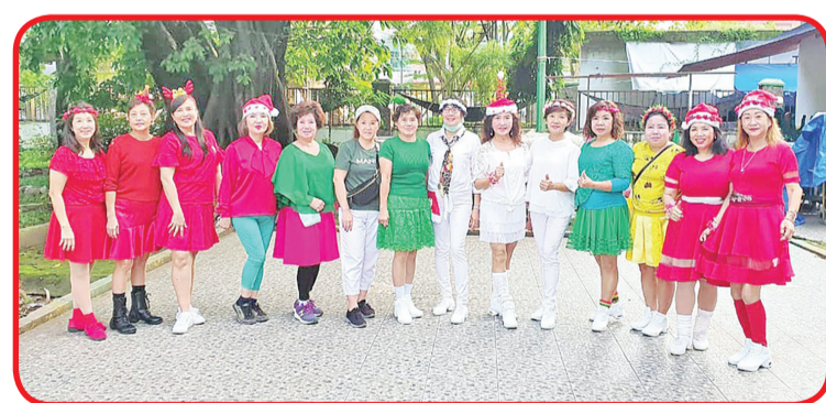
FOTO BERSAMA: Pimpinan Group Srikandi Ellis (keenam dari kanan) berfoto bersama para instruktur dan anggota Group Srikandi.