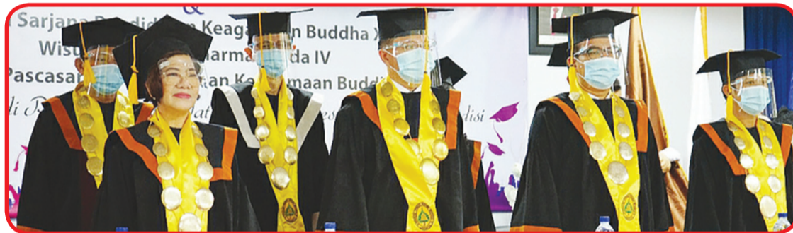
PIMPINAN: Para pimpinan STAB Nalanda menghadiri wisuda STAB Nalanda.