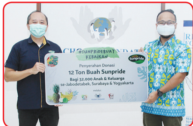
Penyerahan donasi buah ke ReachOut Foundation.