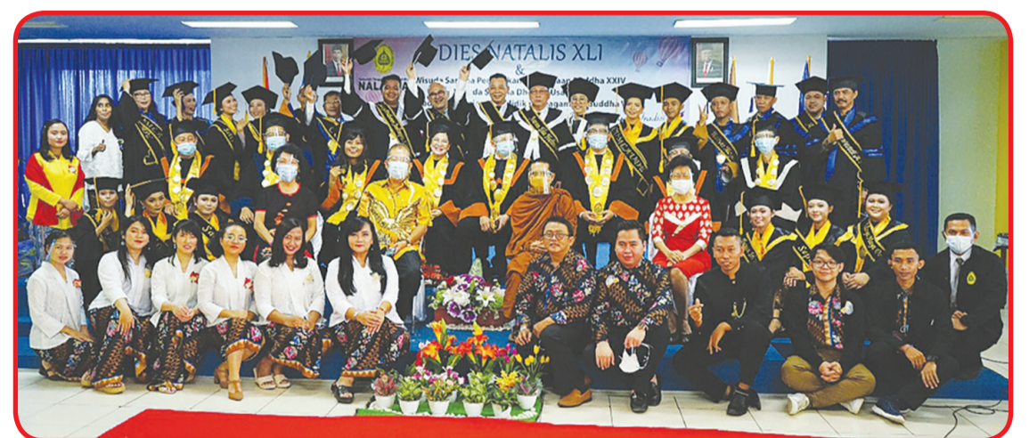
FOTO BERSAMA: Pimpinan yayasan, pimpinan STAB Nalanda, para wisudawan dan staf STAB Nalanda berfoto bersama.