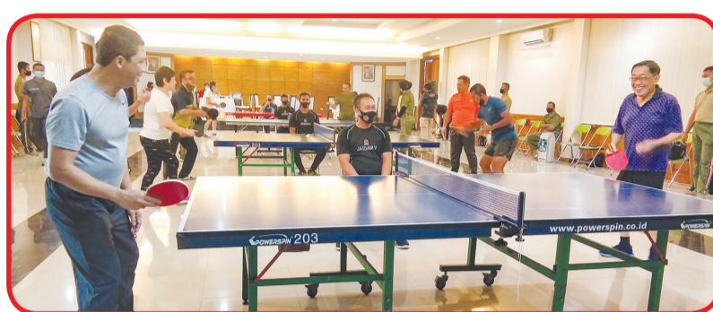
Pertandingan tenis meja persahabatan antara Kodam V Brawijaya dengan Dengkul Club.

kami salurkan pada masyarakat yang membutuhkan. Termasuk pada anggota dan PNS Kodam V Brawijaya yang terdampak Covid-19. Tentu akan kami sampaikan, bahwa ini bukan hanya dari Kodam V Brawijaya. Namun dari berbagai pihak yang memberi bantuan, seperti Maspion Group dan kawan-kawan ini. Intinya sebagai masyarakat yang sudah mampu secara materi, untuk berbagi pada saudara-saudara kita yang kurang beruntung," imbuh Mayjend TNI Suharyanto.