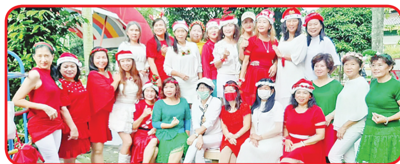
FOTO BERSAMA: Seluruh anggota dan instruktur Group Srikandi berfoto bersama.