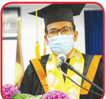
Perwakilan wisudawan menyampaikan ucapan terima kasih.