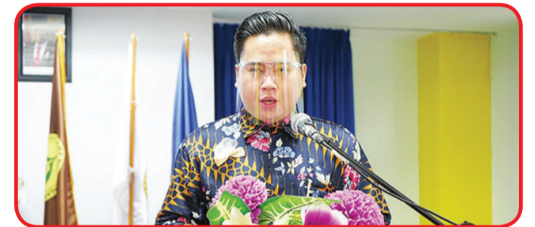
LAPORAN KERJA: Ketua panitia menyampaikan laporan kerja.